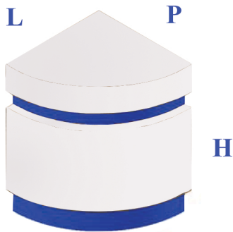
ANGOLO ESTERNO x MOD. LUX